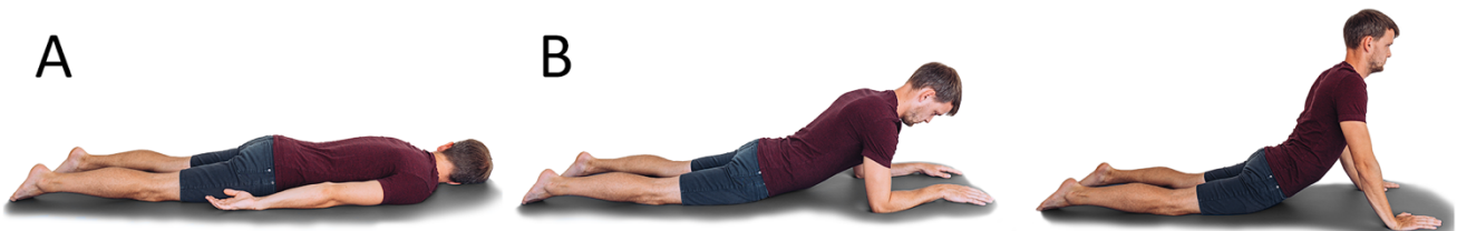
Obr. 1: Cvik 1 - výchozí pozice (A), provedení (B).

!!! Pokud dojde ke změně příznaků (viz „závažné příznaky“), vyhledejte neurologa, event. rehabilitačního lékaře nebo fyzioterapeuta, případně všeobecného praktického lékaře.